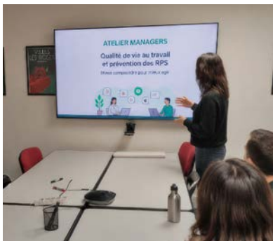
Image générée avec IA

La qualité de vie et des conditions de travail constituent un enjeu majeur pour Seine-Maritime Attractivité.